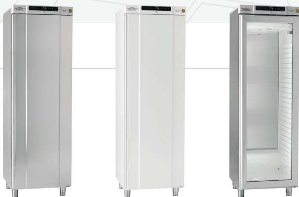
Geräte aus der Serie BioCompact II 410 sind als Kühl- oder Tiefkühlschränke in weiß lackiertem Stahlblech oder in Edelstahl erhältlich. Wählen Sie zwischen isolierter Glastür mit integriertem Licht (RR) oder massiver Tür.

Diese Baureihe ist ebenfalls zur Lagerung von Medikamenten sowie Impfstoffen konzipiert. Die Modellserie kann optional nach den Anforderungen der DIN 58345 ausgestattet werden.