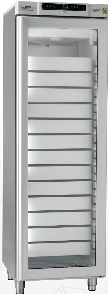
BioCompact II RR410. Schubladen und Glastür stehen als optionales Zubehör zur Verfügung.

Der BioCompact II 410 ist ein Standkühl- oder Tiefkühlschrank.